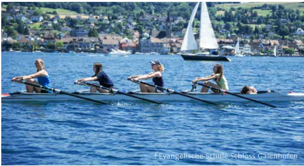
| Evangelische Schule Schloss Gaienhofen