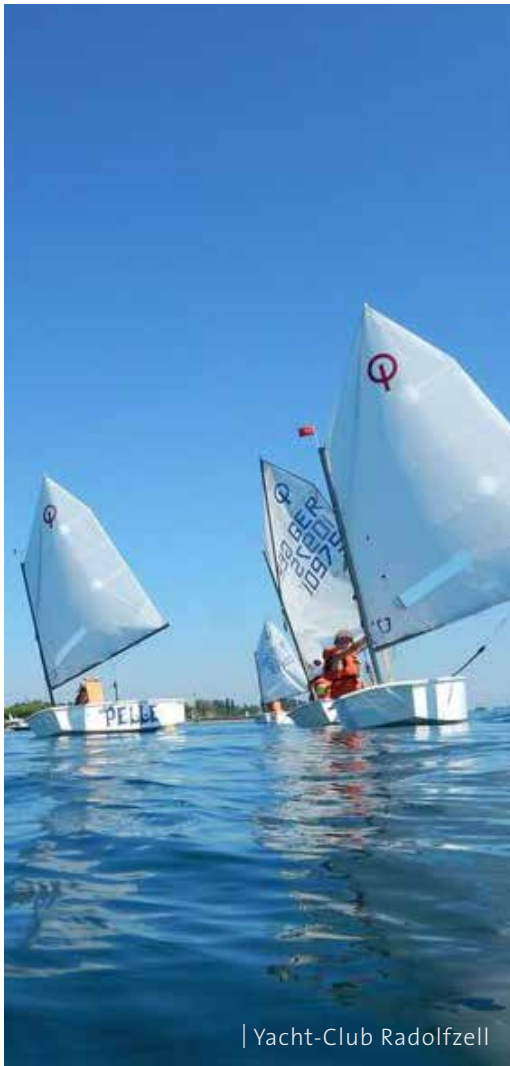
| Yacht-Club Radolfzell