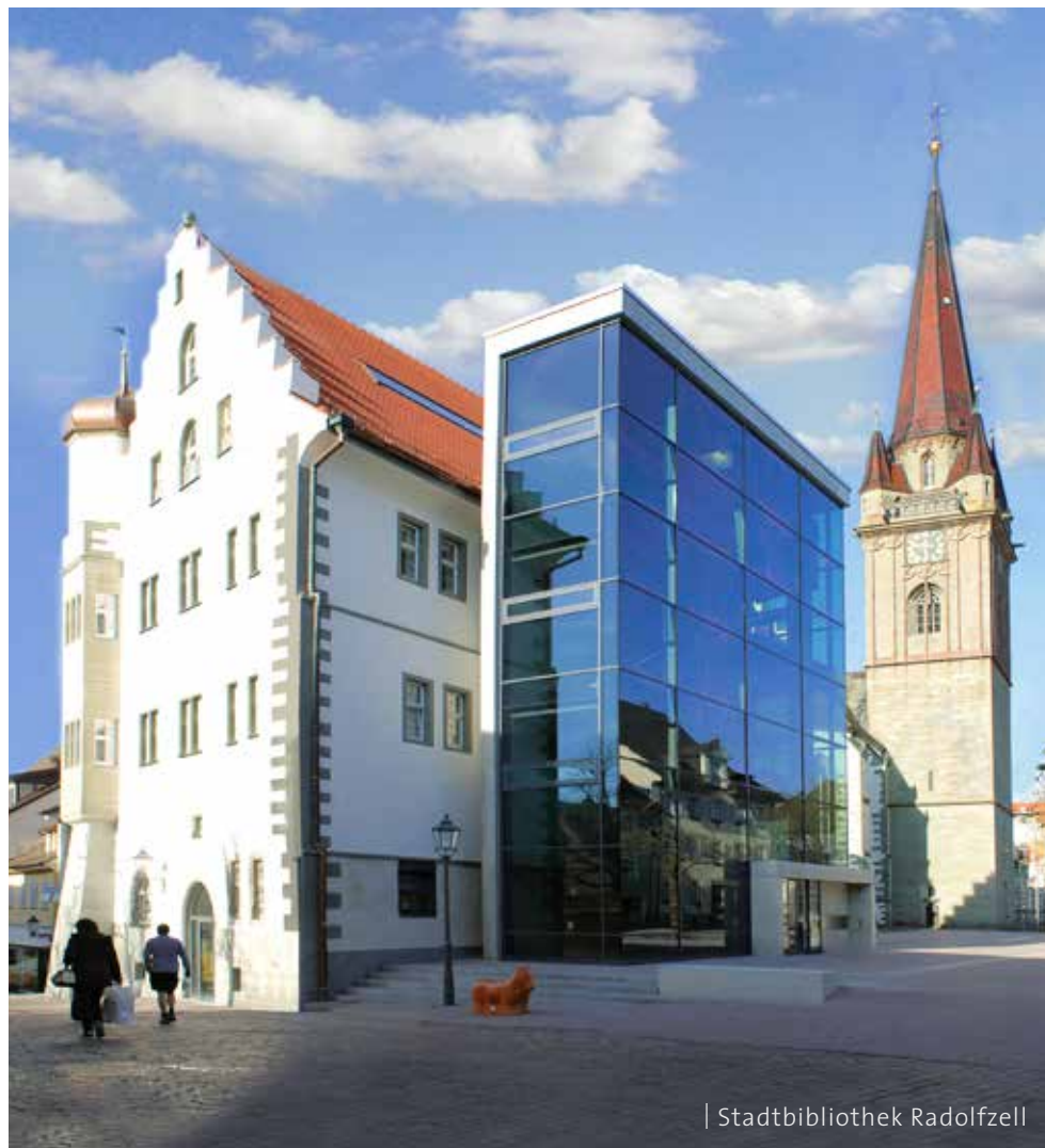
| Stadtbibliothek Radolfzell