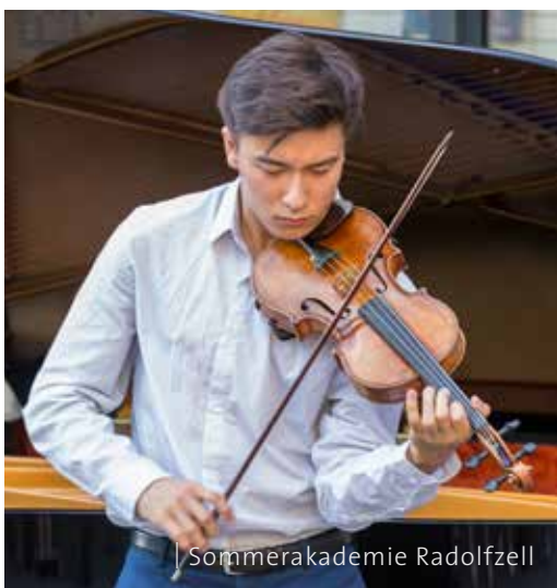
| Sommerakademie Radolfzell