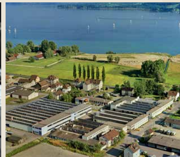
| Firmengelände der ehemaligen Werner Messmer & Co. in Radolfzell.