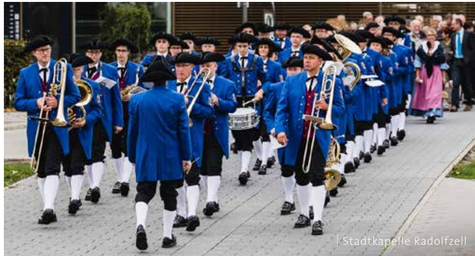
| Stadtkapelle Radolfzell